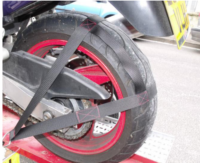
RKH hátsó kerekek rögzítésére