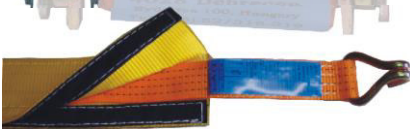
Tépőzárás élvédő rakományrögzítőhöz

Javaslat: sarokvédő használatával a rögzítési biztonság fokozható, az élettartama meghosszabbítható.