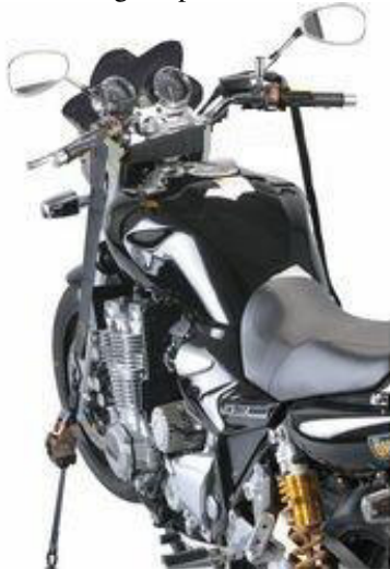
RKM kormány rögzítésére