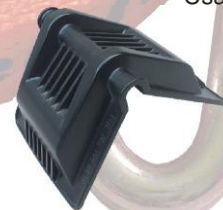
Speciális kivitelű sarokvédő